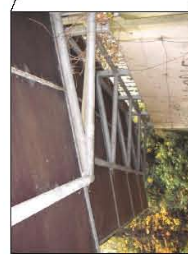
nicht benötigte Überdachungen demonstrieren und abfahren