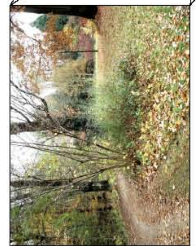
Flächen komplett roden und einsäen