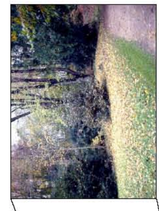
einen Ilex, einen Taxus und Efeu roden, Fläche planieren und einsäen