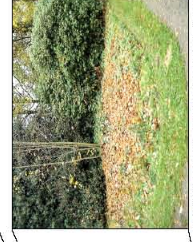
Fläche roden, planieren und einsäen