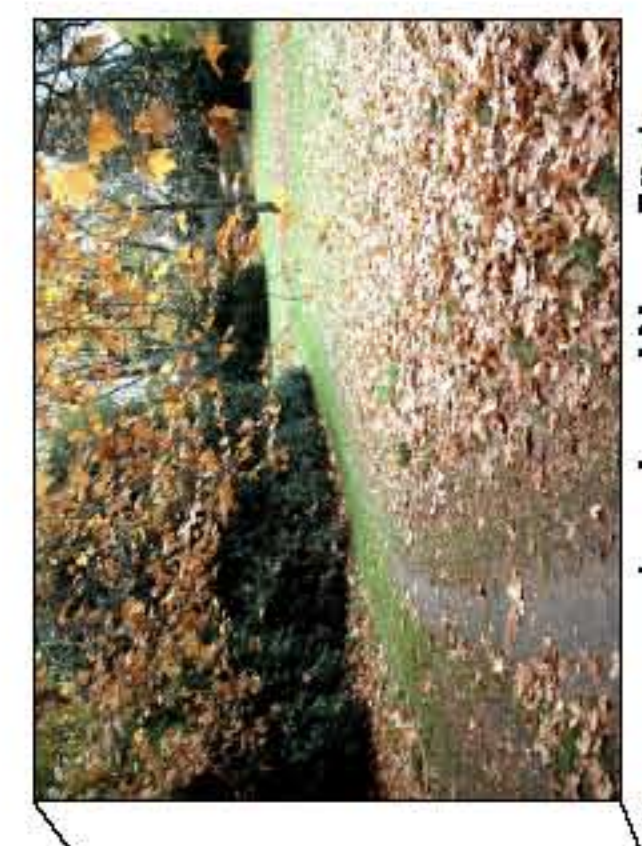
wassergebundene Wegeflächen sanieren