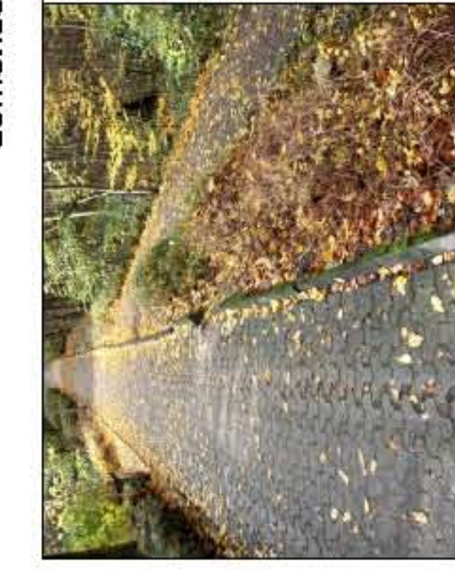
35 m Pflasterweg sanieren, Wegesicherung mit 13 m Winkelstützmauer