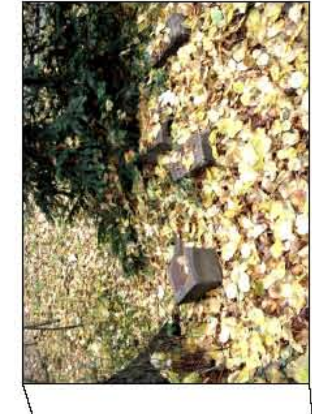
eine Naturstein-Sitzbank wieder herstellen, Bruchstücke-Reste einer anderen entfernen