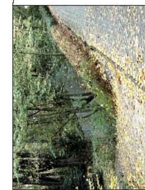
30 m funktionslosen Maschendrahtzaun demonstrieren und abfahren