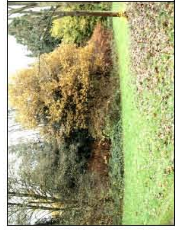
Fläche bis auf einzelne Gehölze roden und einsäen