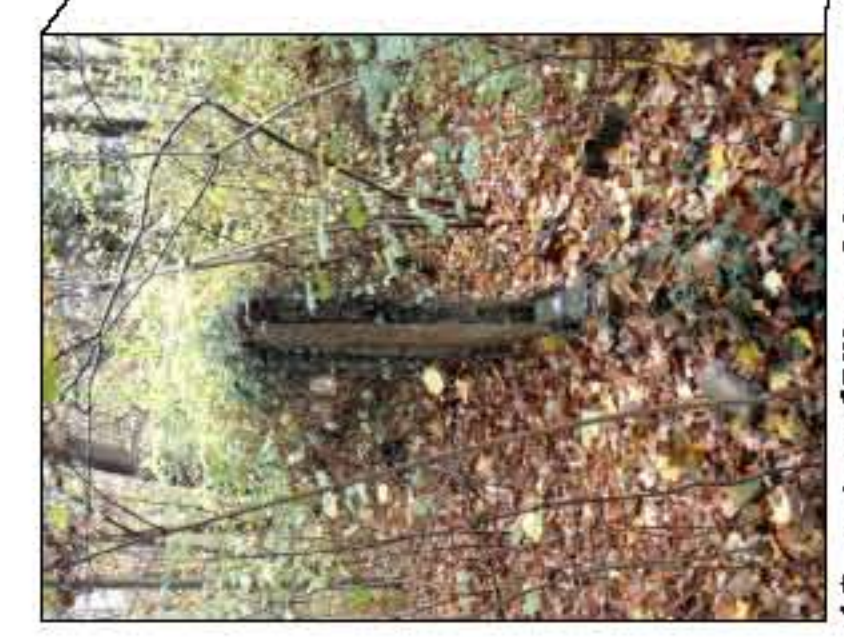
13 m baufällige Mauer abbrechen