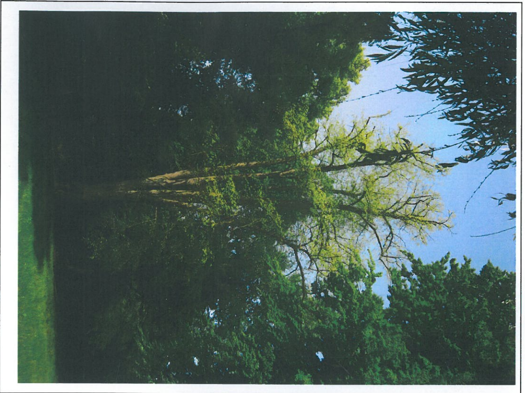
Abb.1: „Restkronen“ der Linde