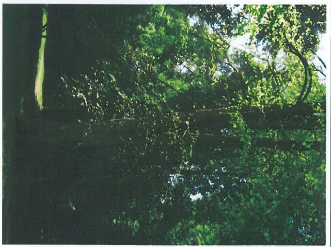
Abb.2: unterer Kronenbereich