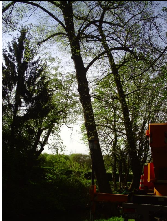
Baum Nr. 23, Linde, am Wassergraben