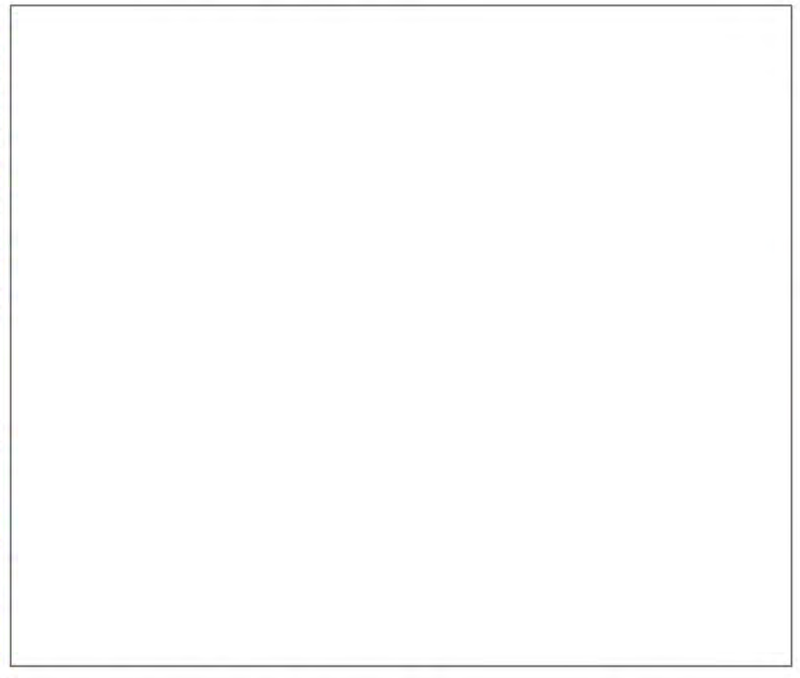
VORHANDENE DARSTELLUNG M: 1:7.500