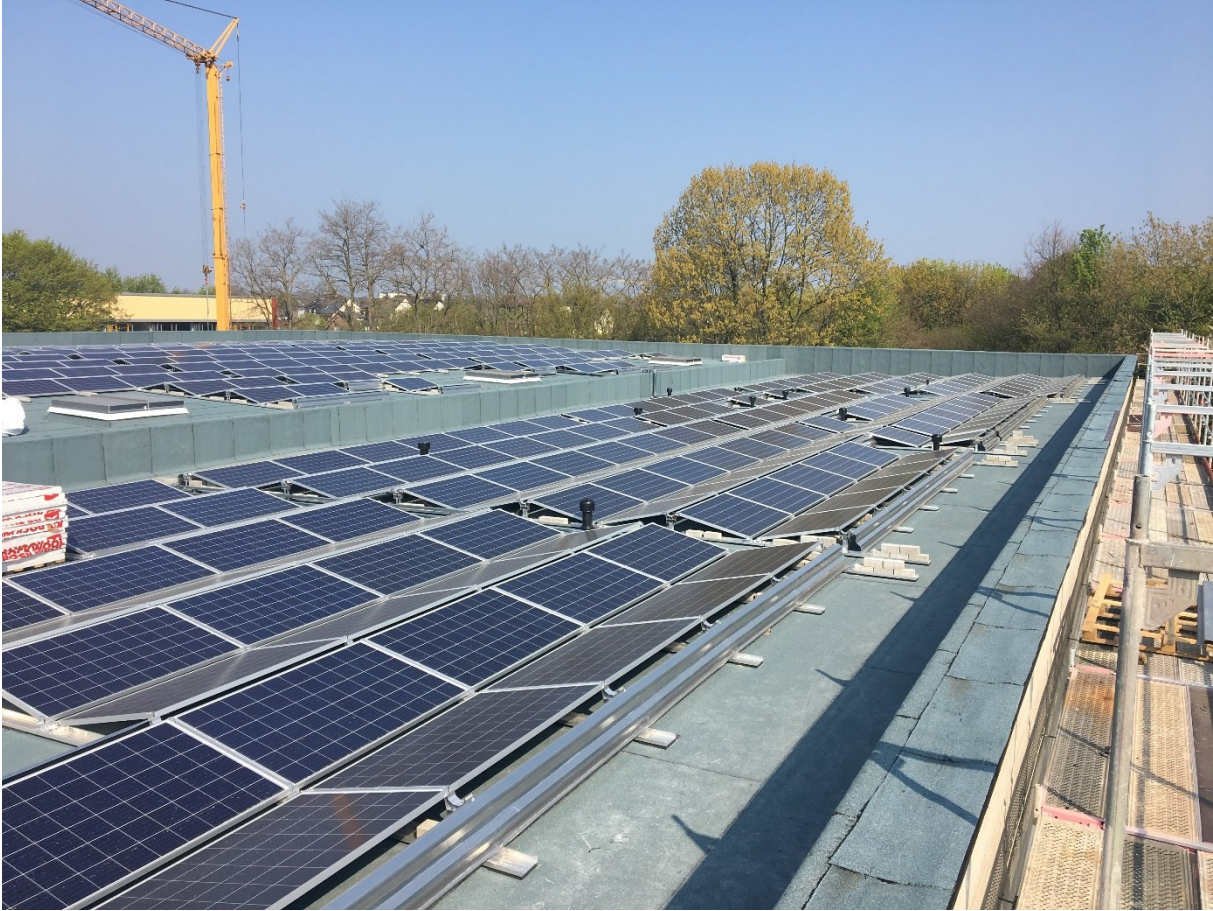
Dachaufsicht 4-fach Halle Deichtorstraße während der Montagearbeiten der Photovoltaik-Anlage