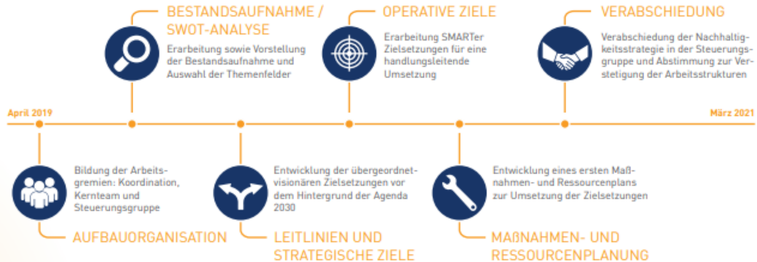
Abbildung 9: Meilensteine der Strategieentwicklung