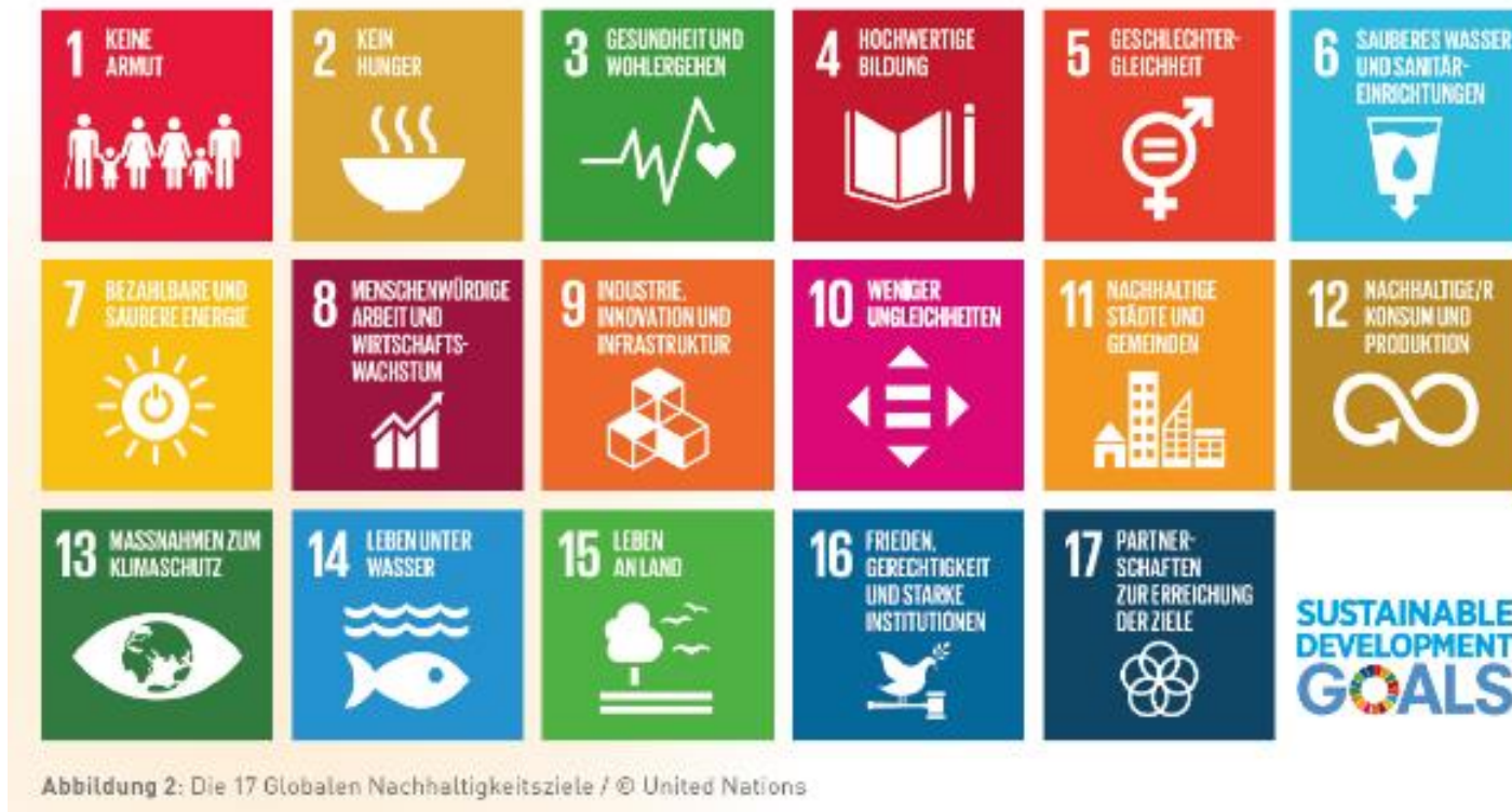
Abbildung 2: Die 17 Globalen Nachhaltigkeitsziele / © United Nations