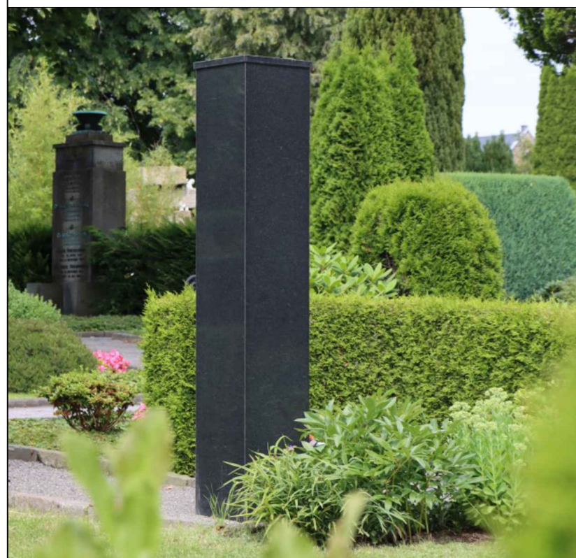
Stele ohne Maßstab