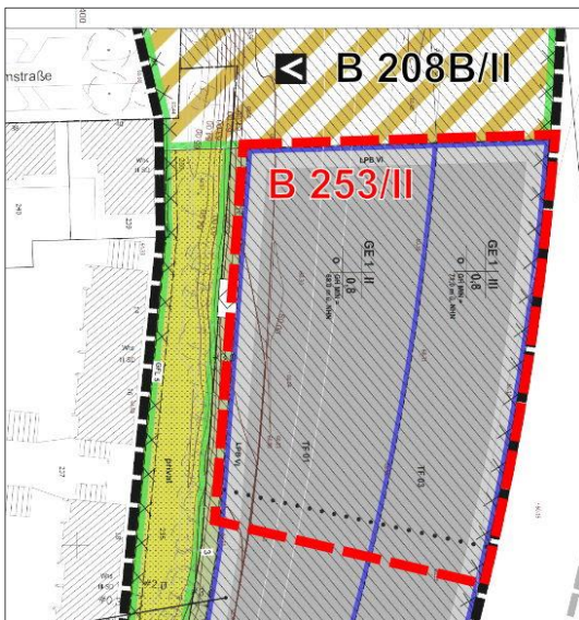
Abb. 5 – Ausschnitt des im Bereich der vorliegenden Planung bisher rechtswirksamen B-Plans Nr. 208 B/II (ohne Maßstab).

Der Geltungsbereich des Bebauungsplans Nr. 253/II liegt auf einer Teilfläche des Bebauungsplans Nr. 208 B/II "Opladen – nbso/Westseite – Quartiere" für die ein „Eingeschränktes Gewerbegebiet“ (GE 1) festgesetzt ist.