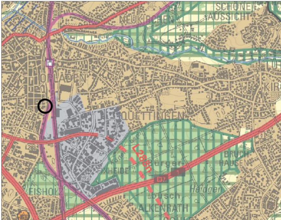
Abb. 3 – Ausschnitt (ohne Maßstab) aus dem Regionalplanentwurf 2021/22 für den Regierungsbezirk Köln.

Aufgrund der Detailunschärfe der Regionalplanebene (Maßstab 1:50.000) sind im Vergleich zum bisherigen Regionalplan für das relativ kleine Plangebiet keine wesentlichen Änderungen festzustellen. Das Plangebiet befindet sich hier im „Allgemeinen Siedlungsbereich“ (ASB) weiterhin neben der Signatur für „Schienenwege“. Die südöstlich vom Plangebiet liegende GIB-Fläche (Bereiche für gewerbliche und industrielle Nutzungen) ist im neuen Regionalplanentwurf etwas kleiner geworden und ermöglicht eine Ausweitung des „Allgemeinen Siedlungsbereiches“.