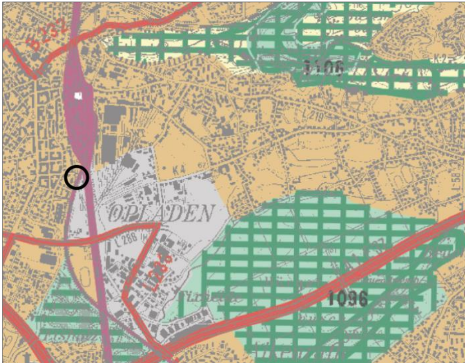
Abb. 2 – Ausschnitt (ohne Maßstab) aus dem Regionalplan für den Regierungsbezirk Köln.

Der derzeitige Regionalplan hat seinen Planungshorizont erreicht und soll überarbeitet werden. Die Bezirksregierung Köln hat im Amtsblatt Nr. 17 vom 29.04.2019 über das Verfahren zur Überarbeitung des Regionalplans informiert.