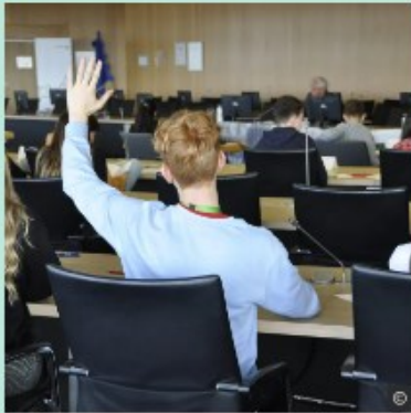
Freizeit Jugendstadtrat: jetzt anmelden → mehr