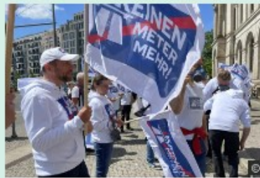
Planen und Bauen Keinen Meter mehr! → mehr