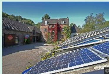
Umwelt Klimaschutz und Nachhaltigkeit → mehr

Zusätzlich dazu wurde eine neue Unterseite konzipiert, die Bebauungspläne und öffentliche Auslegungen zusammenfasst: https://www.leverkusen.de/stadt-entwickeln/planen-bauen/bauleitplaene . Diese Unterseite ist im Bereich „Stadt entwickeln“ angesiedelt.