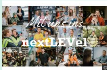
Service Ausbildung 2025: jetzt bewerben → mehr