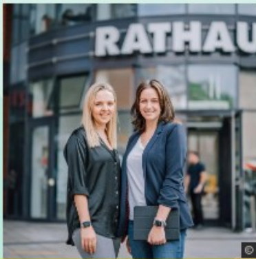
Service Bürgerbeteiligung → mehr