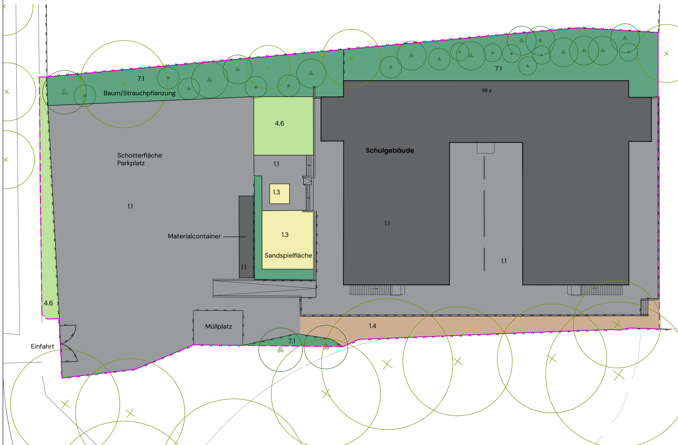
Lageplan Bestand M 1:250