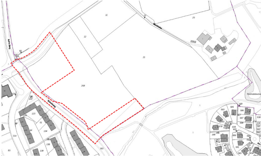
Abbildung 1: Geltungsbereich des Bebauungsplans 251/III Mathildenhof – Kita Bohofsweg

Straßenabschnitte „Bohofsweg“ im Westen und dem asphaltierten Feldweg „In der Wasserkuhl“ im Norden sind überwiegend von Gehölzen bestockt. Am westlichen Rand des Geltungsbereiches tragen die straßenbegleitenden Gehölzbestände zur Ortsrandeingrünung bei.