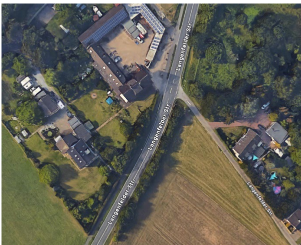
Anlage 2 zum Antrag Reparatur der Leitplanke Langenfelder Straße / Neujudenhof Google Maps Ansicht der Lokalisierung der defekten Leitplanke