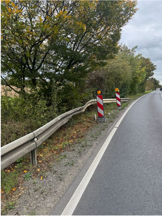
Anlage 1 zum Antrag Reparatur der Leitplanke Langenfelder Straße / Neujudenhof Bilddokumentation der defekten Leitplanke an der Langenfelderstraße/Neujudenhof / Ansicht Fahrtrichtung Leverkusen