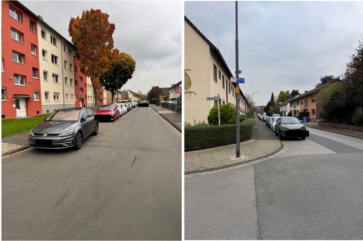
Anlage 1 zum Antrag Einrichtung von Parkmarkierungen an der Flurstraße Hitdorf Ansicht von die Flurstraße a) Fährstraße b) Kocherstraße.