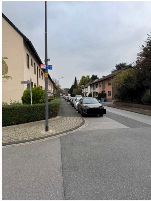
Anlage 1 zum Antrag Einrichtung von Parkmarkierungen an der Flurstraße Hitdorf Ansicht von die Flurstraße a) Fährstraße b) Kocherstraße.