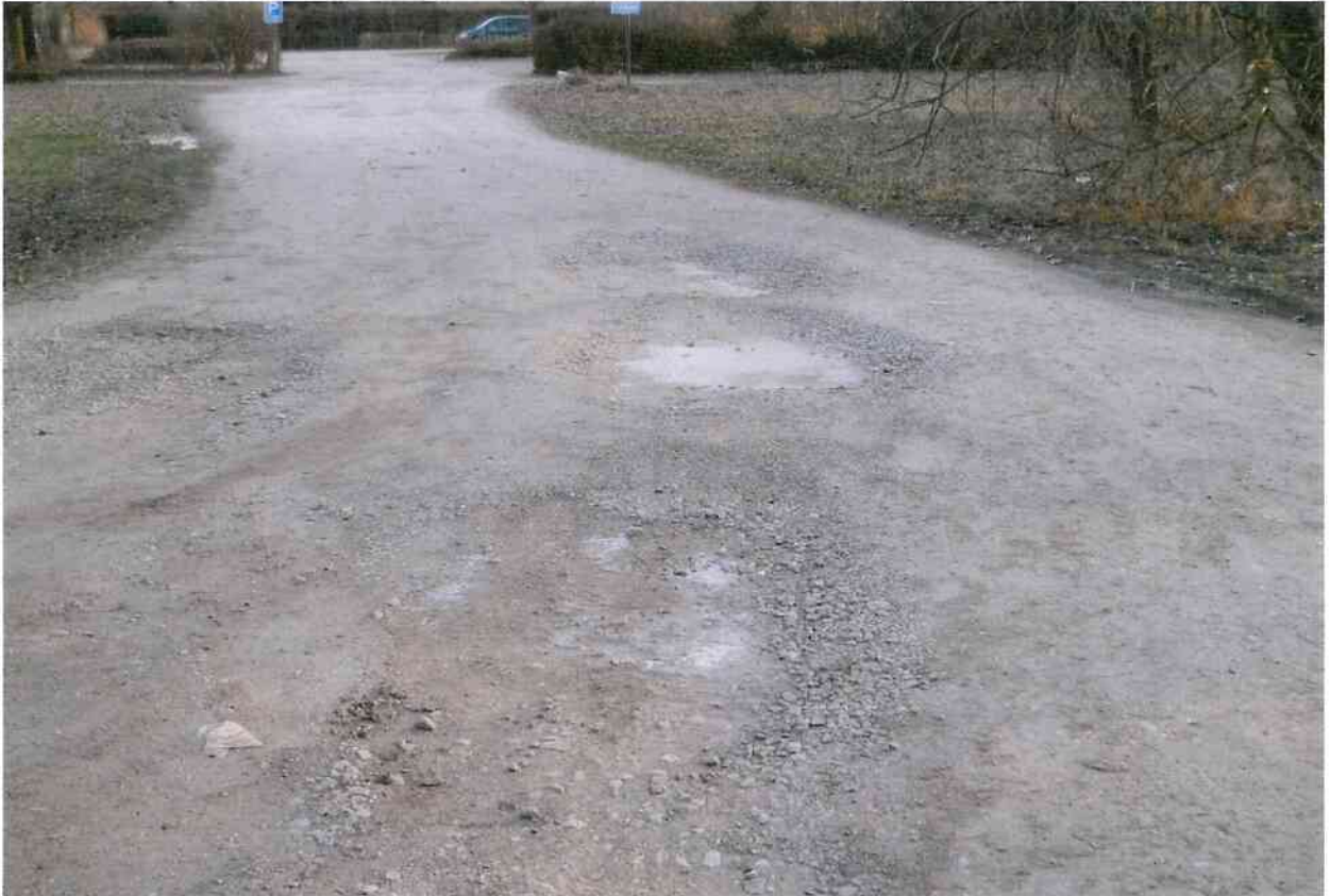
Zufahrt Kleingartenanlage Manfort