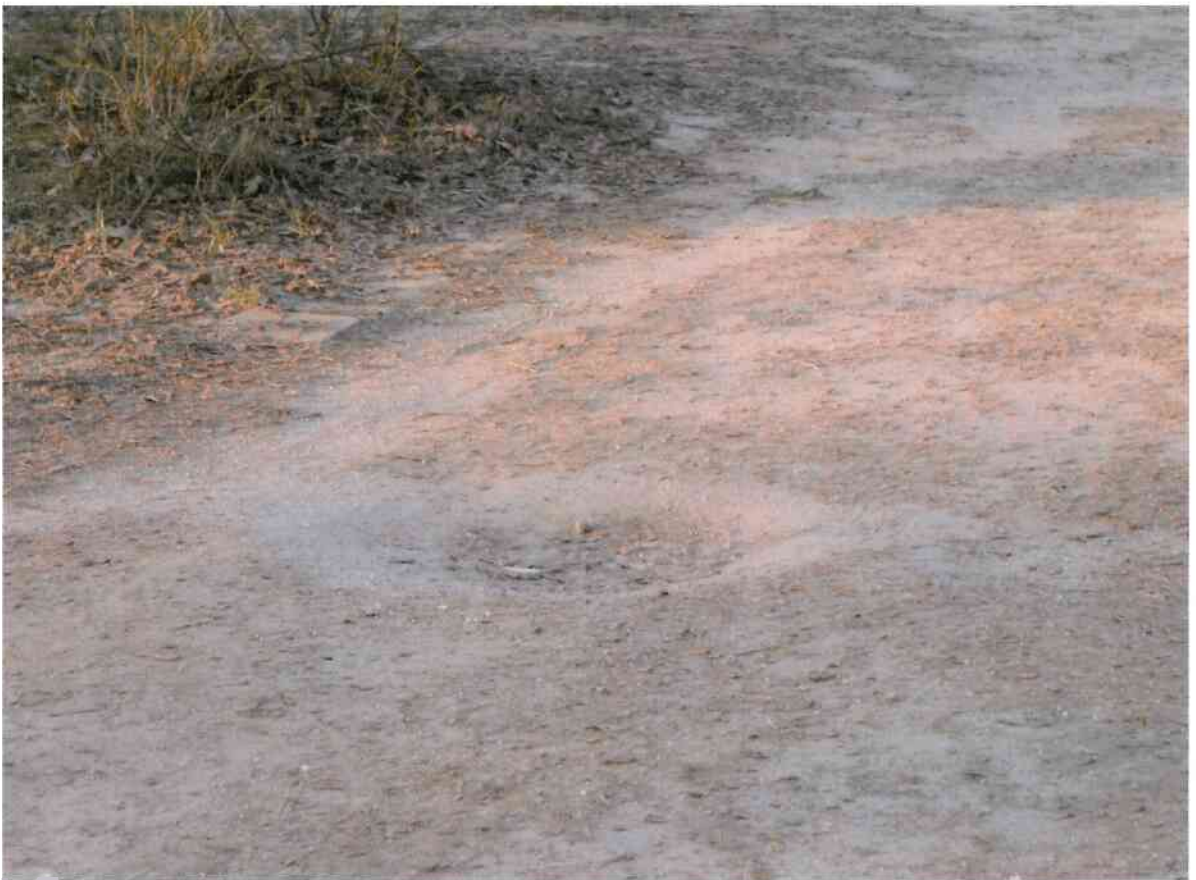
Zufahrt Kleingartenanlage Burgloch