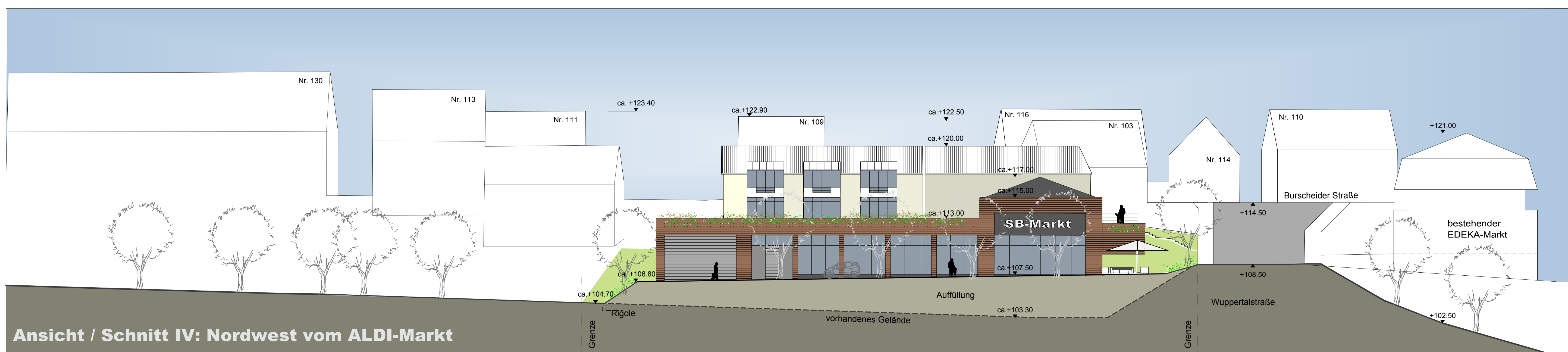
Ansicht / Schnitt IV: Nordwest vom ALDI-Markt