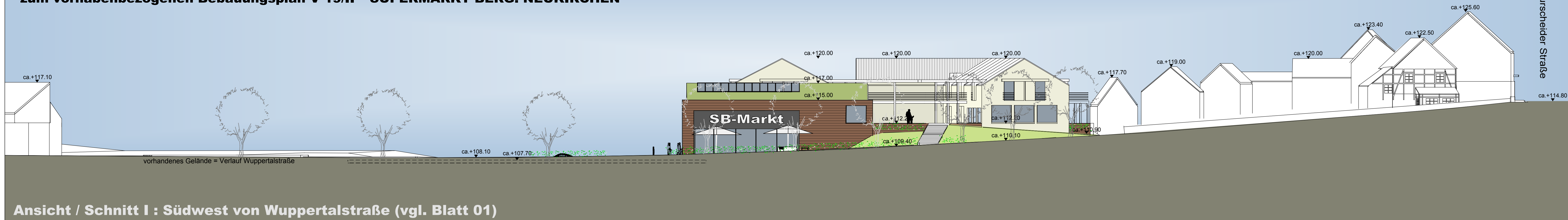
Ansicht / Schnitt I : Südwest von Wuppertalstraße (vgl. Blatt 01)