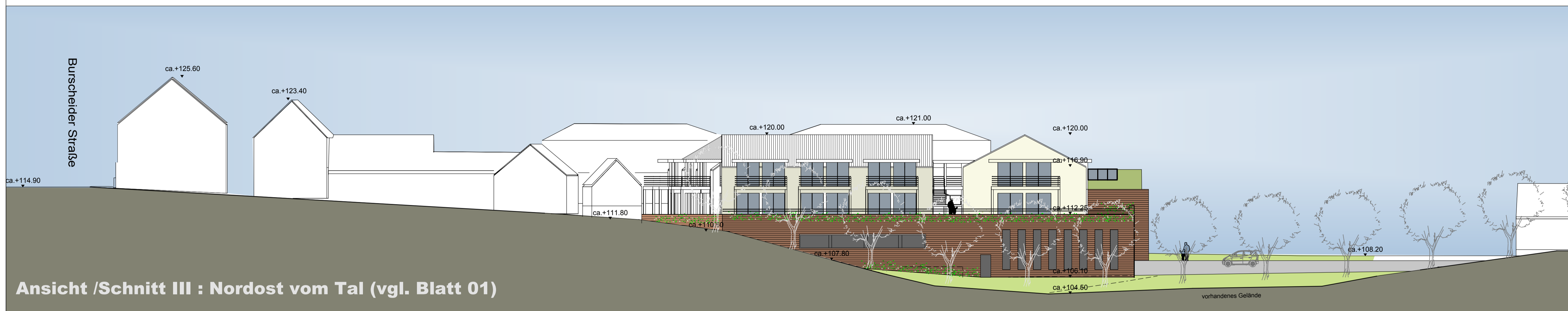
Ansicht / Schnitt III : Nordost vom Tal (vgl. Blatt 01)