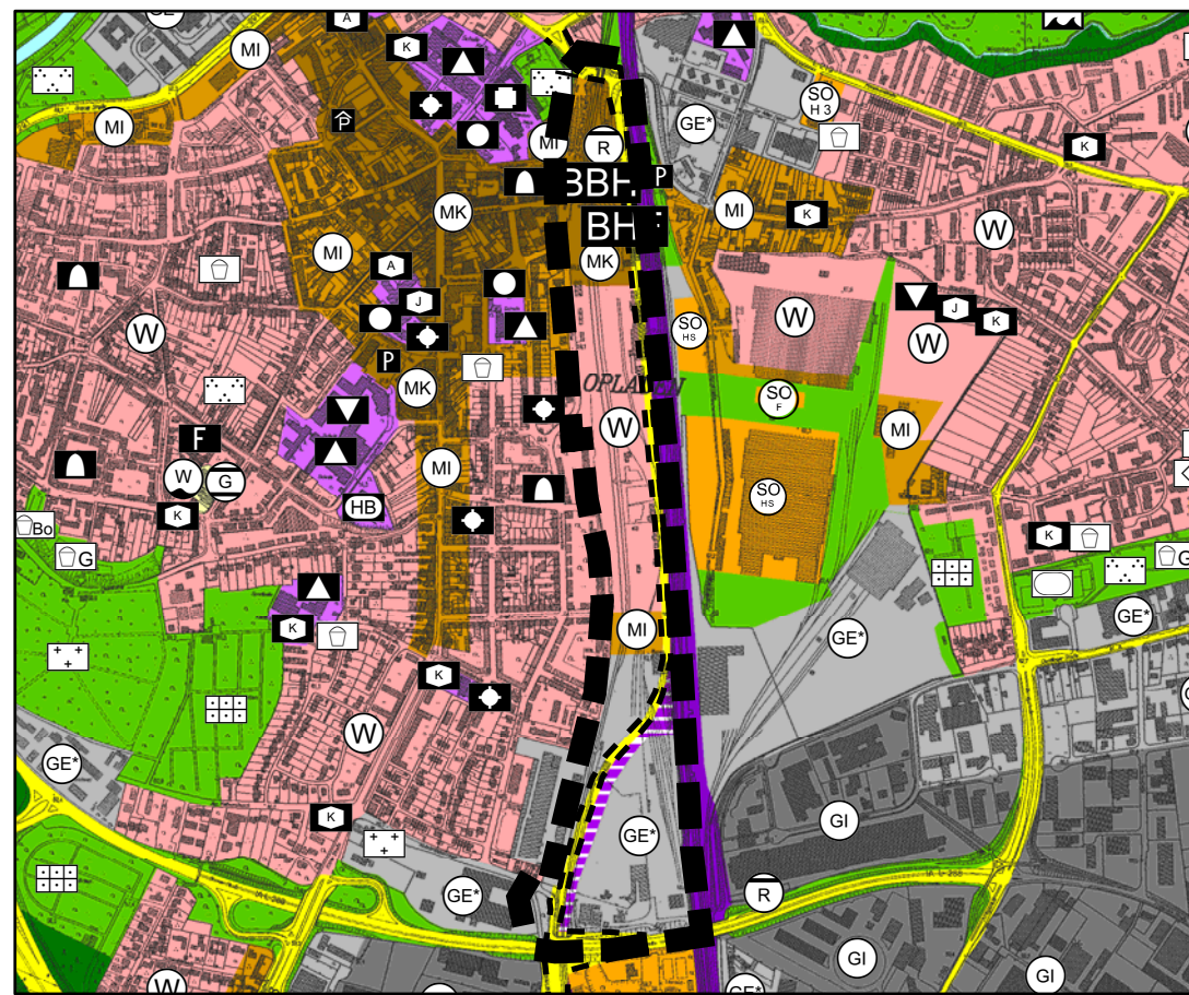
VORHANDENE DARSTELLUNG M.: 1 : 15.000