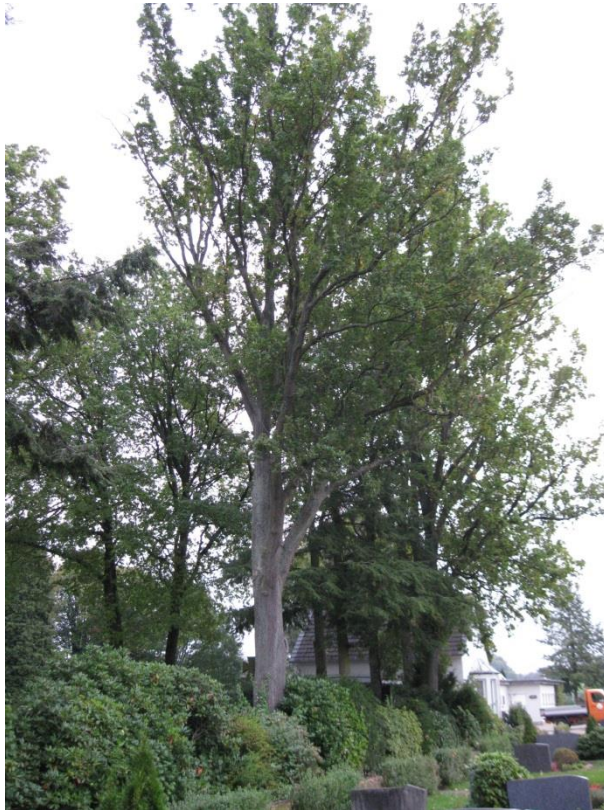
Standort des Baumes mit der Arbeits-Nr. 709