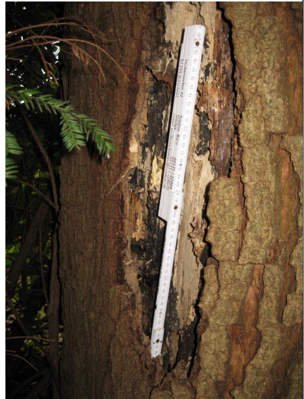
Faulstelle auf nördlicher Stammseite