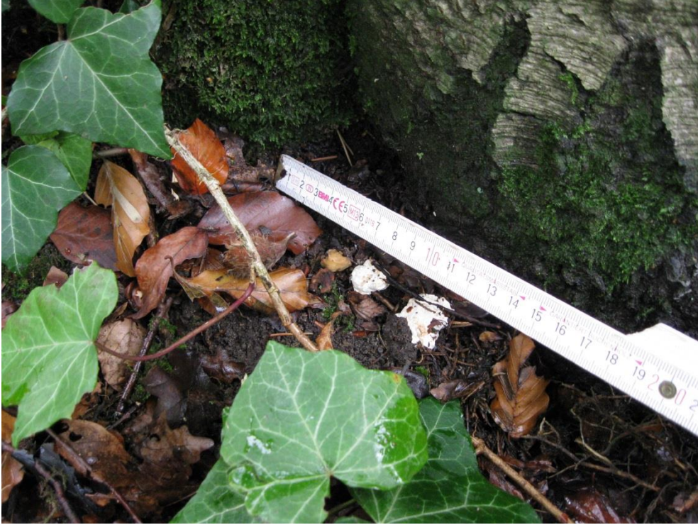
Fruchtkörper des Brandkrustenpilzes am westlichen Stammfuß