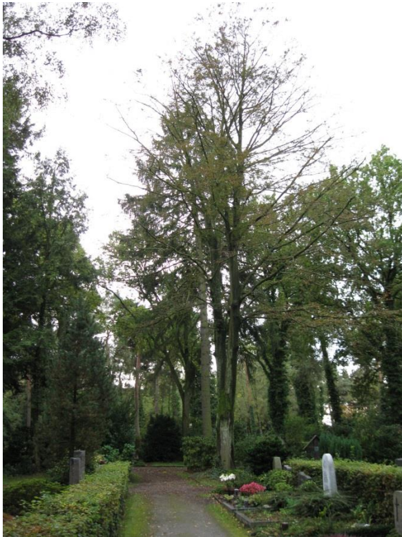
Standort Baum-Nr. 744 (Blickrichtung Süd)