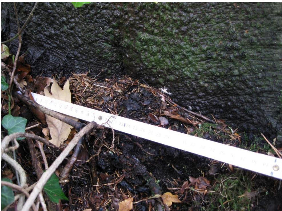
Fruchtkörper des Brandkrustenpilzes am südlichen Stammfuß