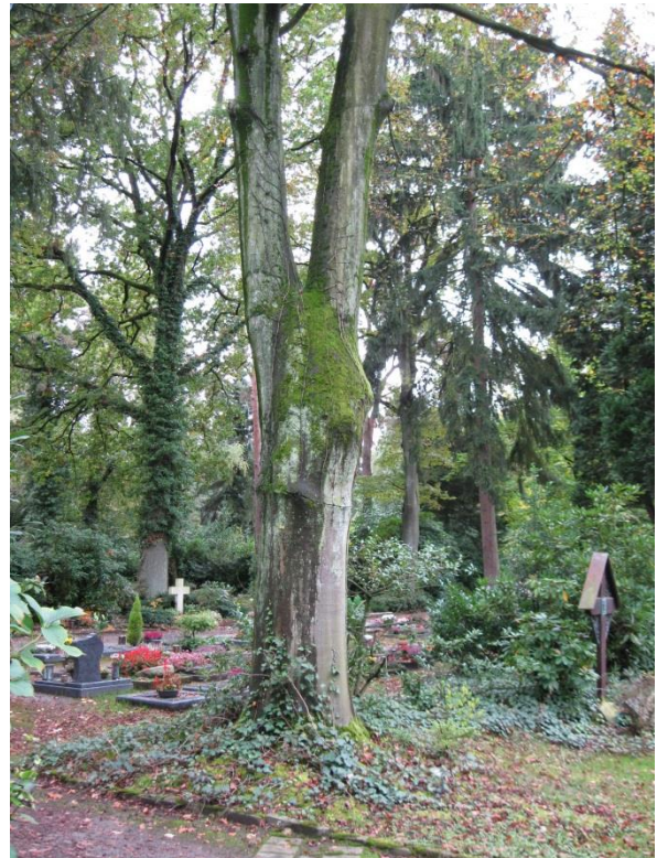
Standort Rotbuche Feld 3