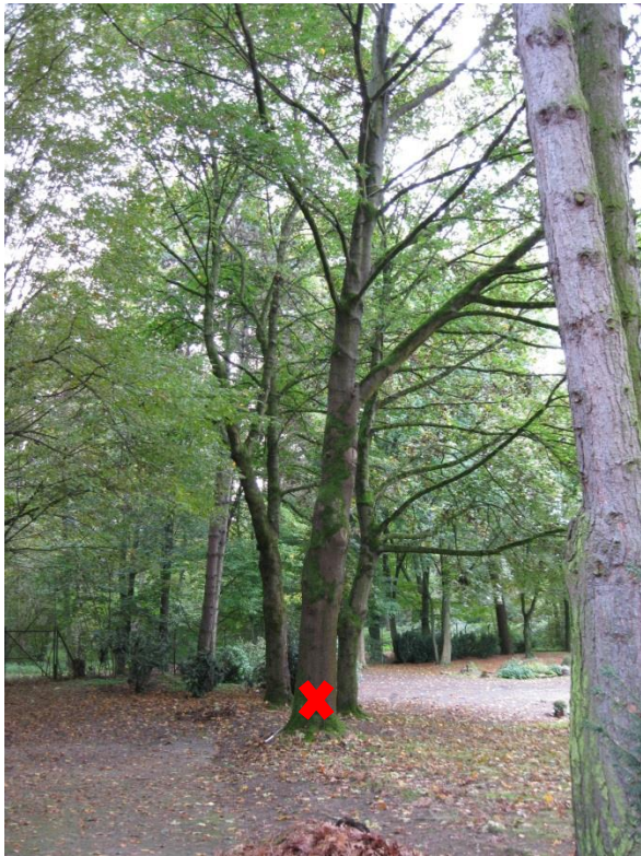
Standort Baum-Nr. 690 (Blickrichtung Ost)