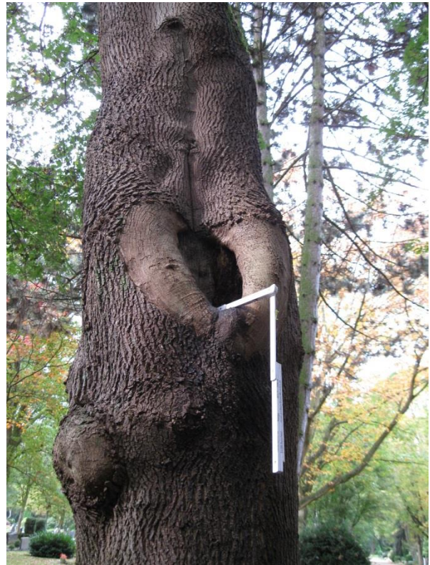
Große, eingefaltete Astungswunde auf östlicher Stammseite