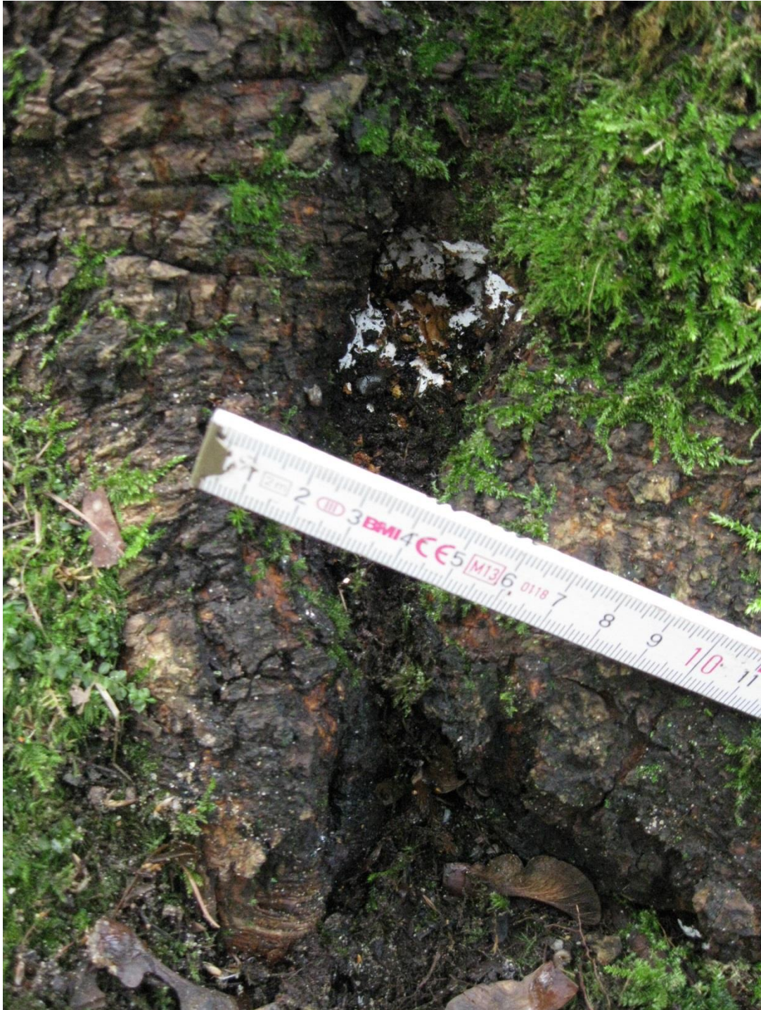
Nebenfruchtform des Brandkrustenpilzes am nördl. Stammfuß