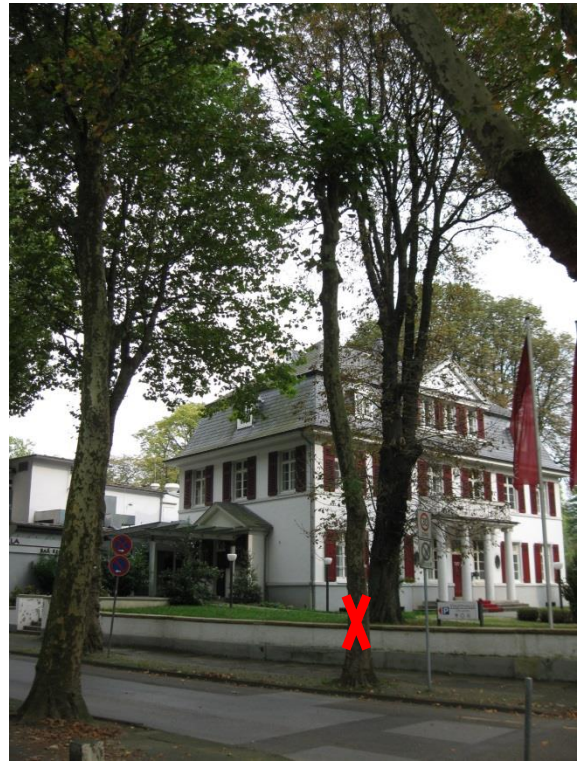
Standort Baum Nr. 14 (Blickrichtung Ost)