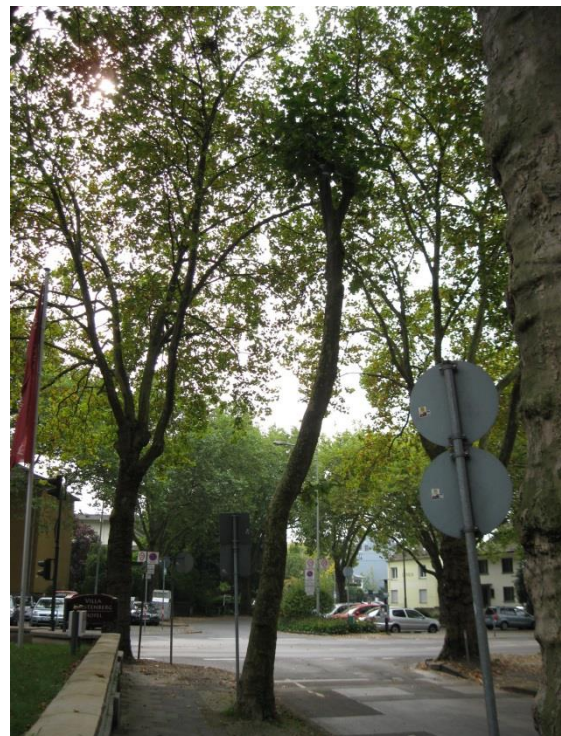
Standort Baum Nr. 14 (Blickrichtung Süd)