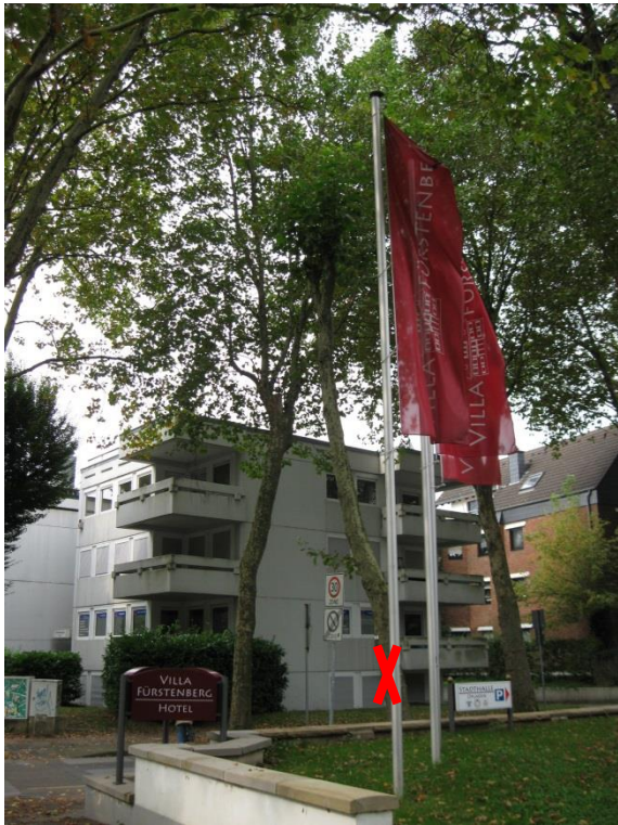
Standort Baum Nr. 14 in der Fürstenbergstraße