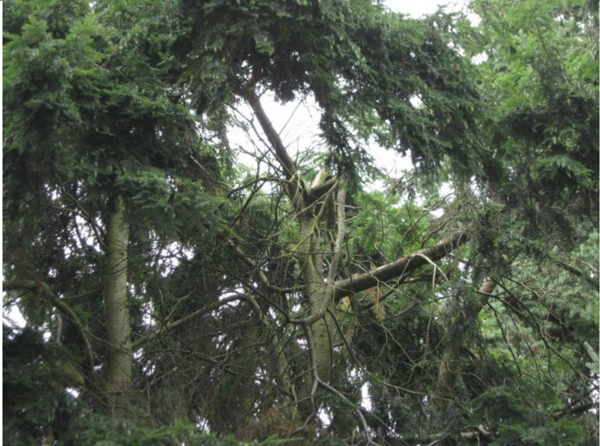
Abgebrochene Terminale am nördlichen Stämmeling