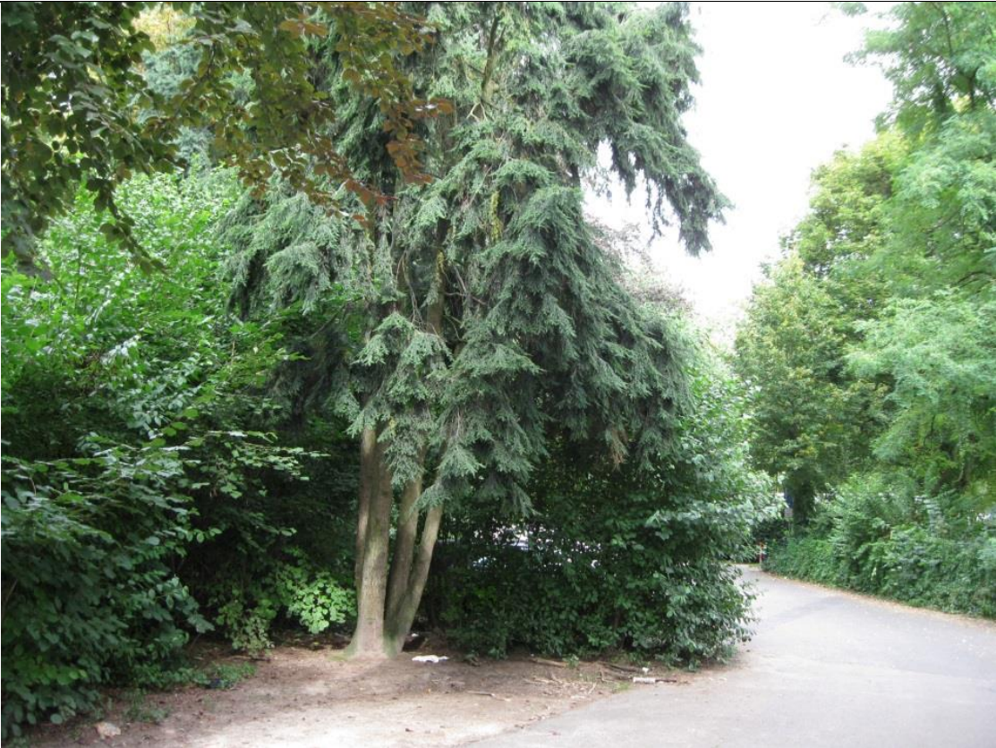
Standort Hemlocktanne am Parkplatz am Sportplatz Am Weidenbusch (Blickrichtung Nord)