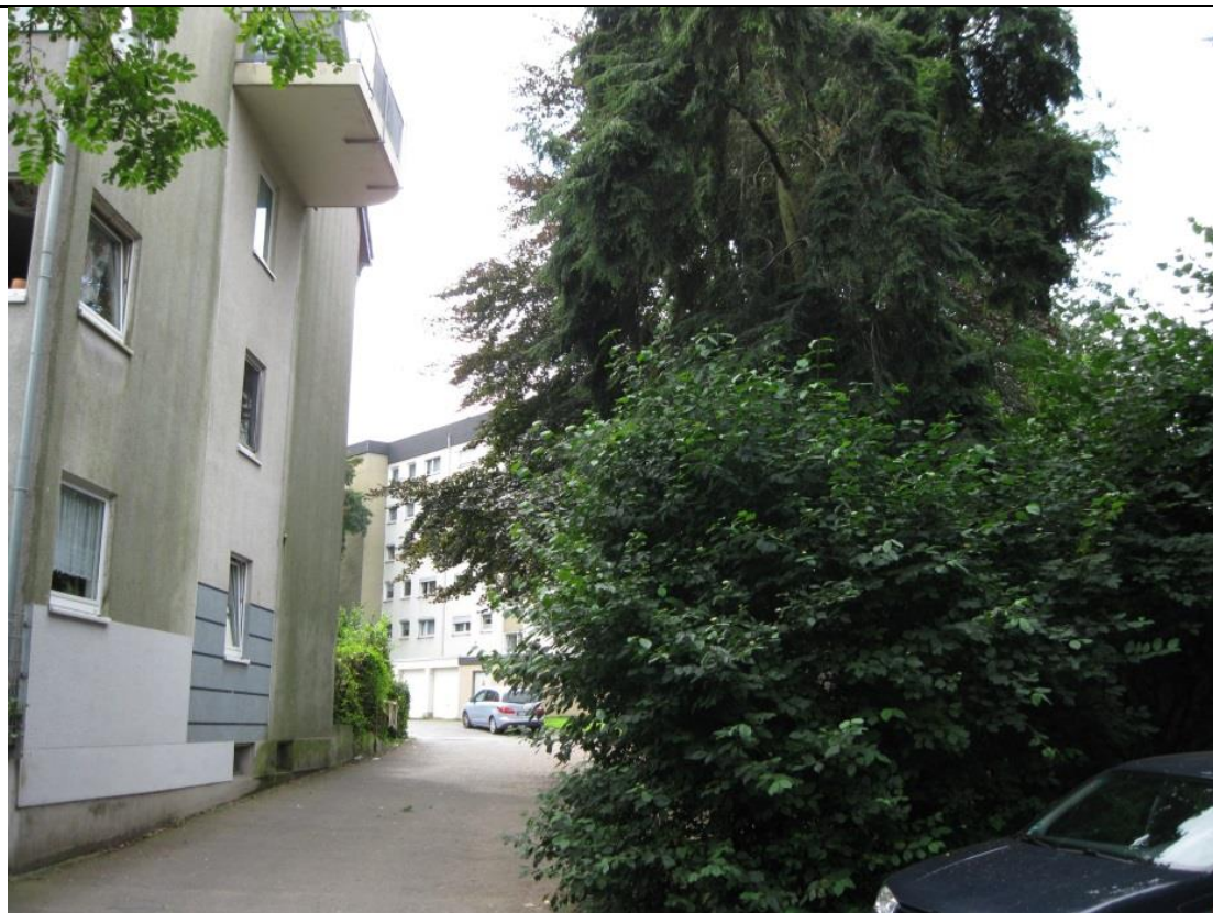
Standort Hemlocktanne am Parkplatz am Sportplatz Am Weidenbusch (Blickrichtung Süd)