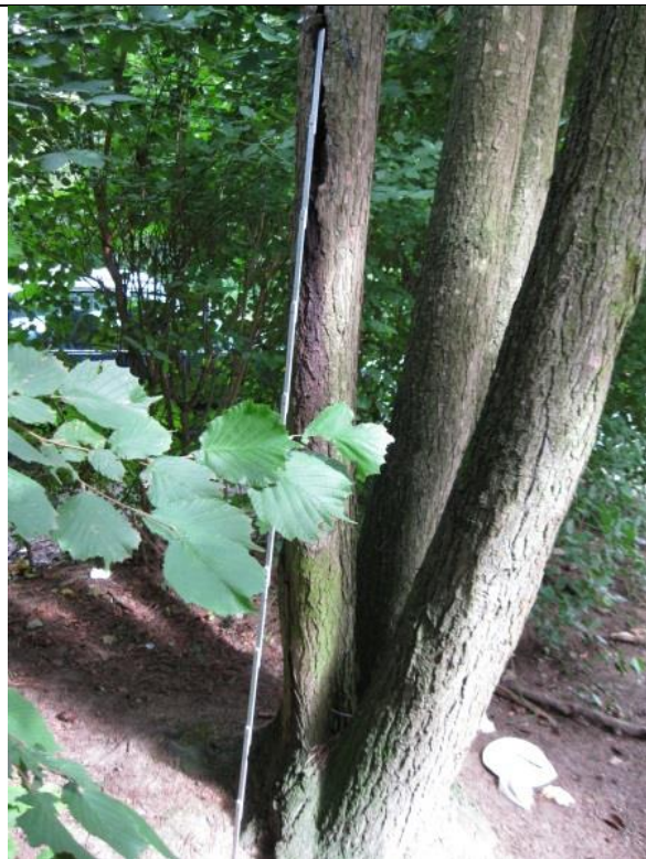
Stammriss am westlichen Stämmeling