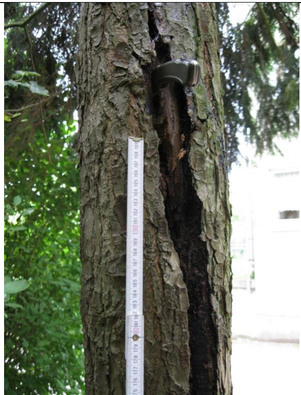
Eingefalteter Stammriss am westlichen Stämmeling