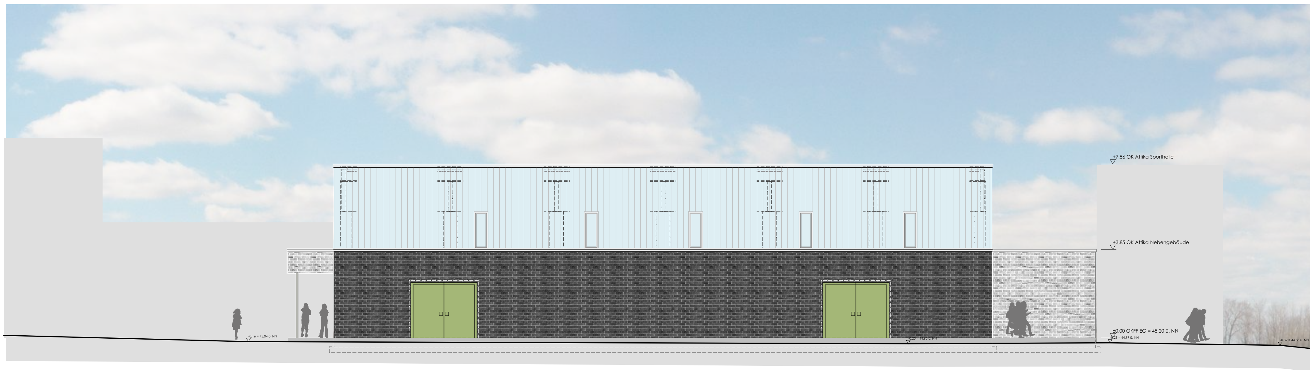
SPORTHALLE GGS LÖWENZAHN NORDANSICHT 1:100