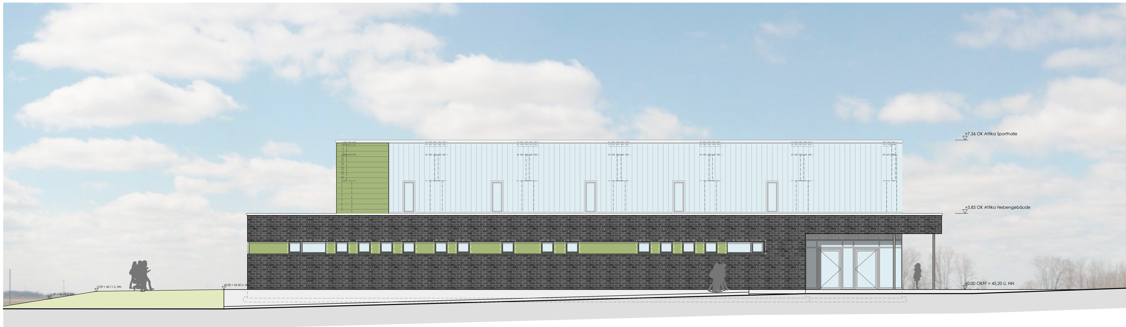
SPORTHALLE GGS LÖWENZAHN SÜDANSICHT 1:100