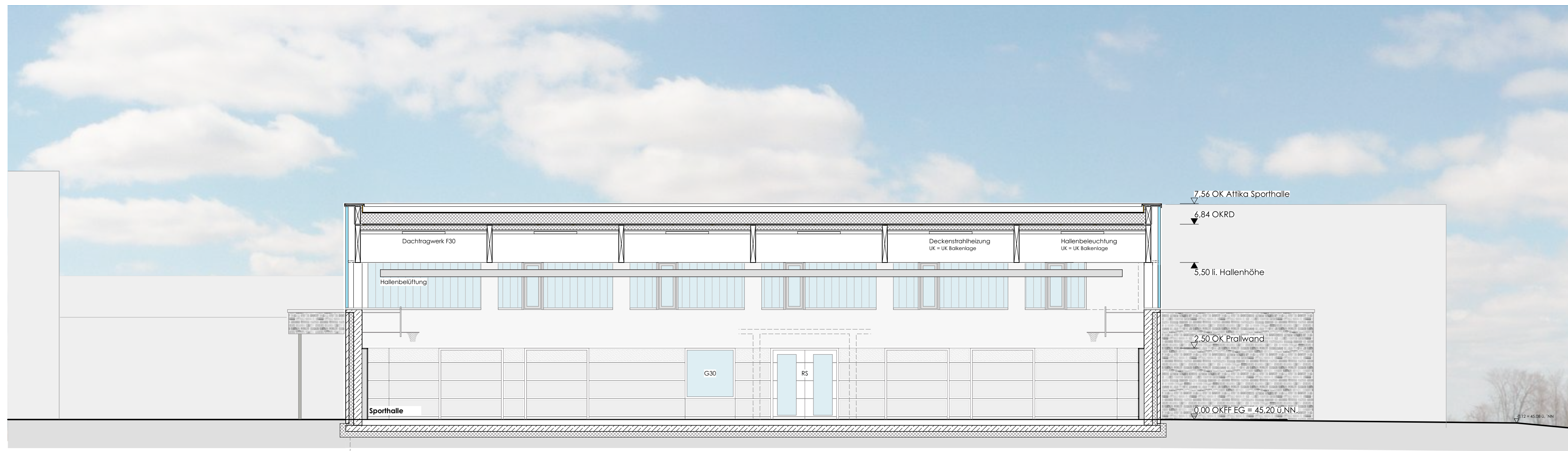
SPORTHALLE GGS LÖWENZAHN SYSTEMSCHNITT BB 1:100