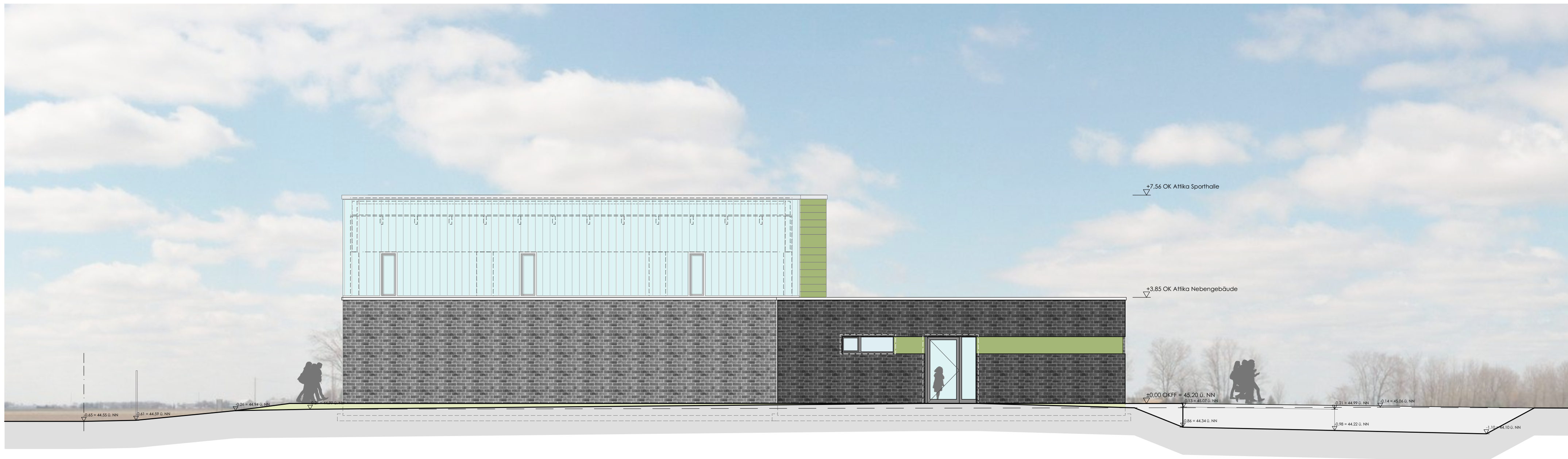
SPORTHALLE GGS LÖWENZAHN WESTANSICHT 1:100