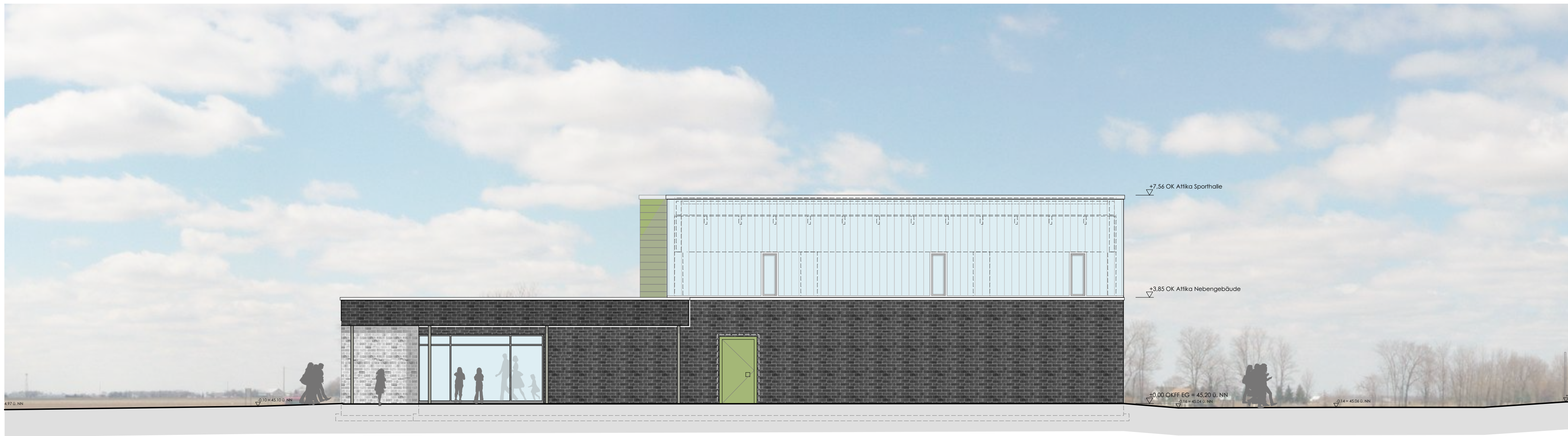
SPORTHALLE GGS LÖWENZAHN OSTANSICHT 1:100