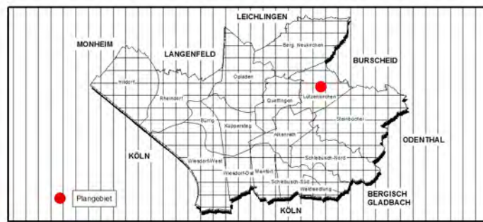
GEPLANTE DARSTELLUNG M.: 1:5.000