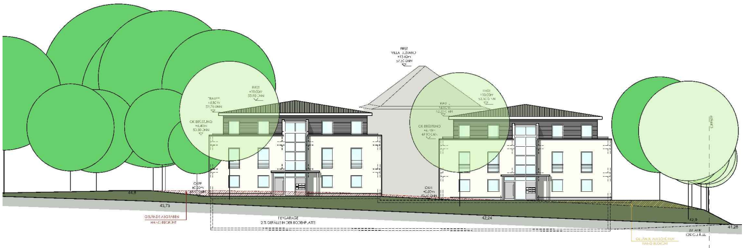
Straßenansicht "Am Werth"