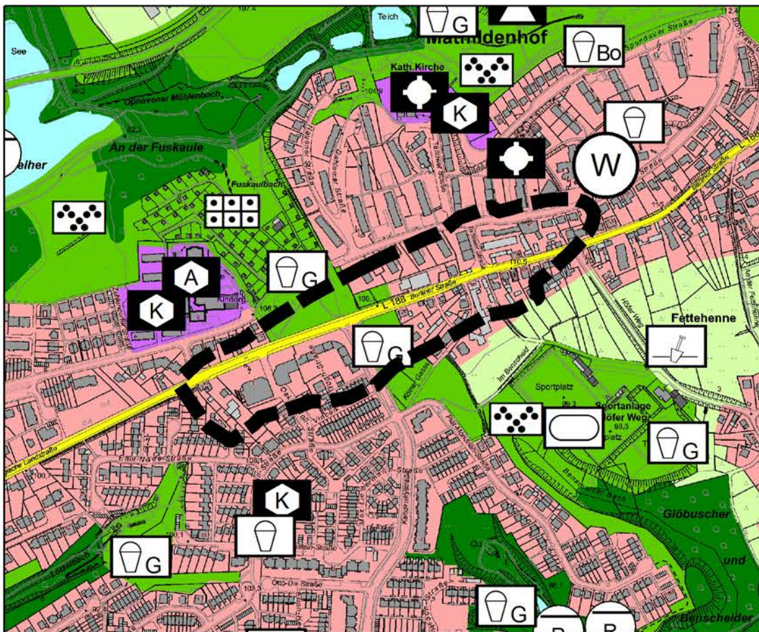
VORHANDENE DARSTELLUNG M.: 1:7.500

BEREICH: NAHVERSORGUNGSZENTRUM FETTEHENNE