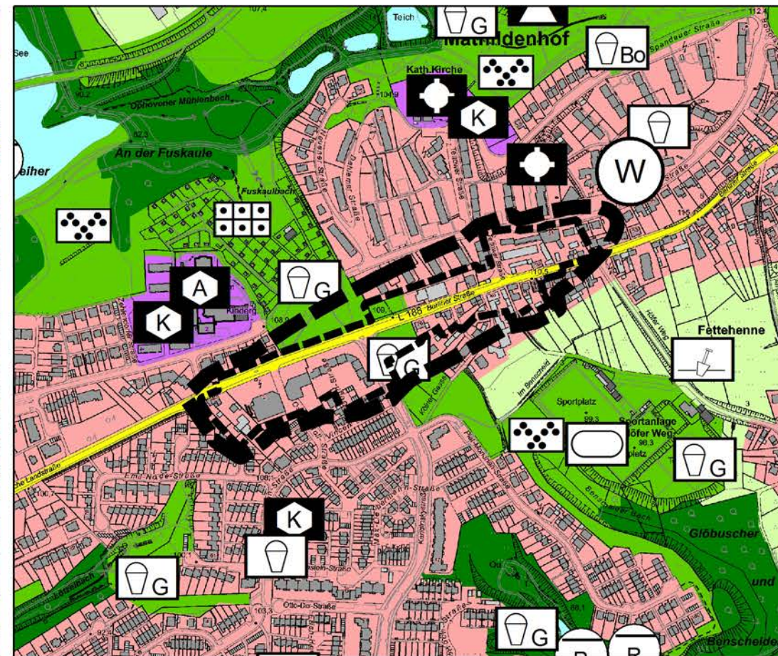
GEPLANTE DARSTELLUNG M.: 1:7.500