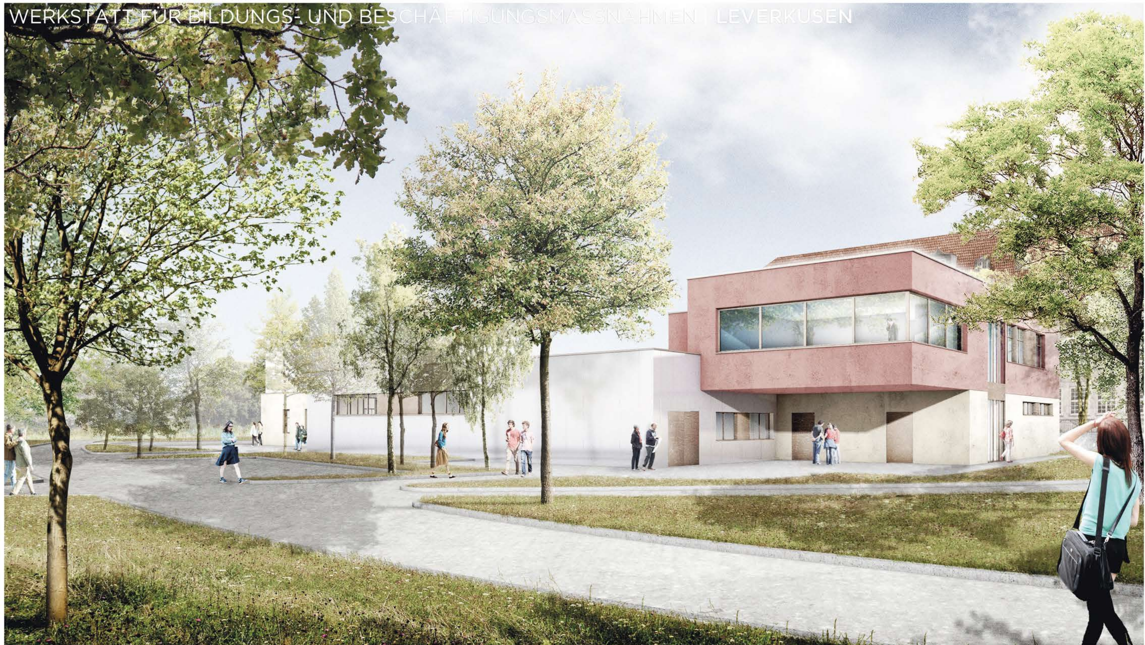
Blick vom Stadtpark