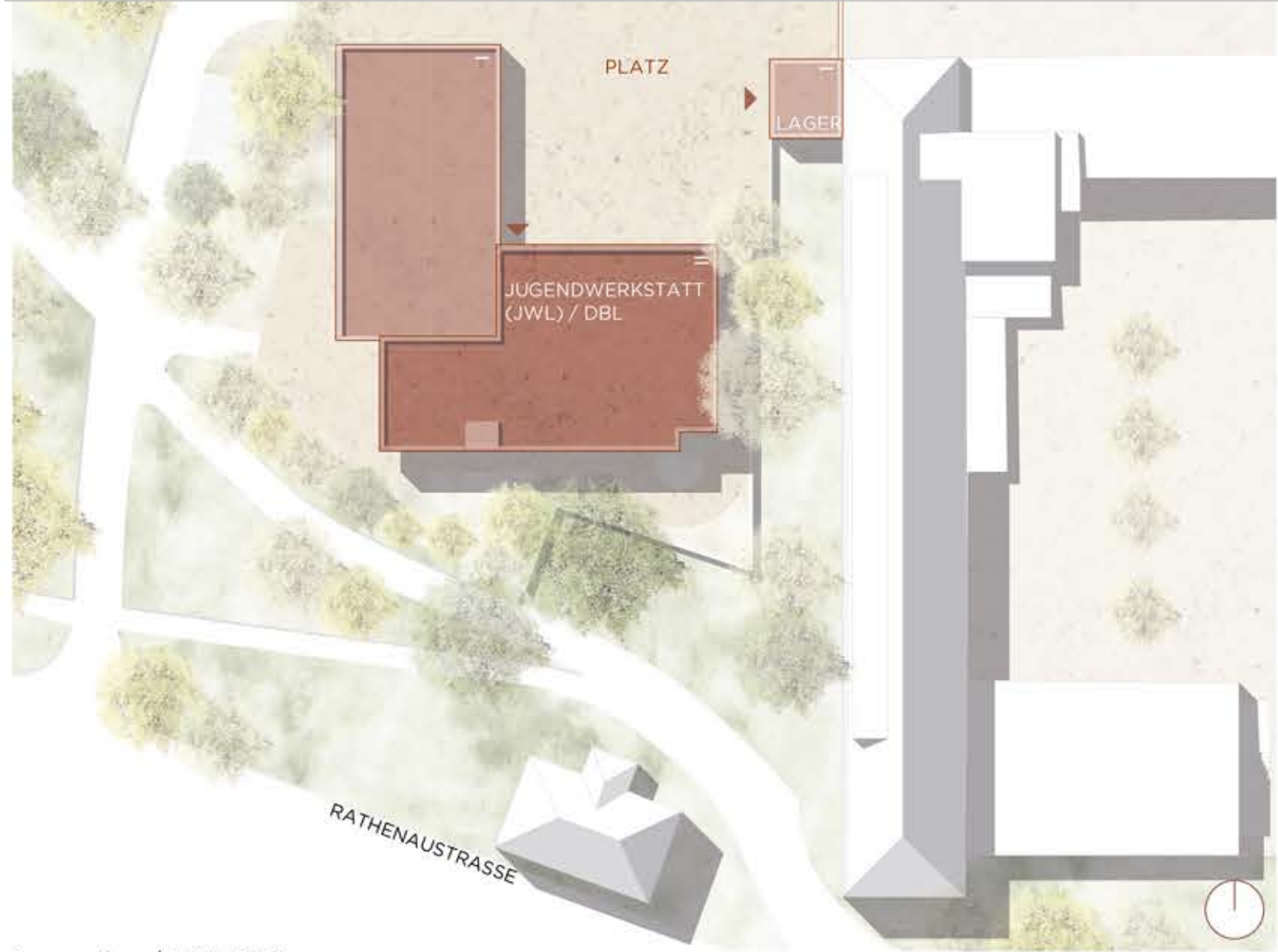
Lageplan | M 1:500