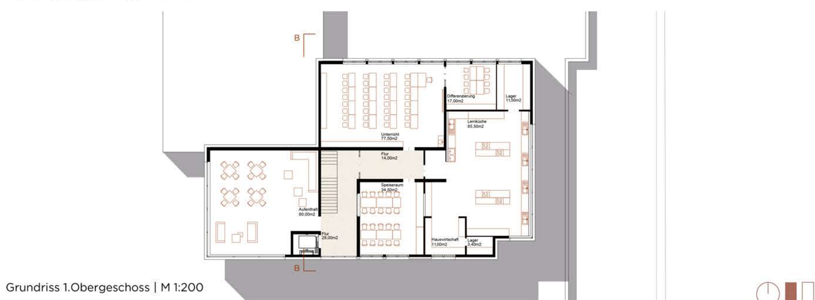
Grundriss 1.Obergeschoss | M 1:200