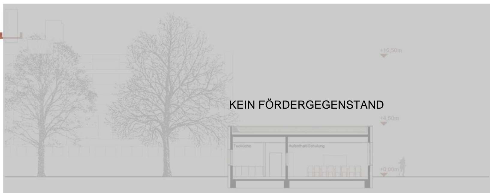
JOBService/DBL Schnitt A-A | M 1:200