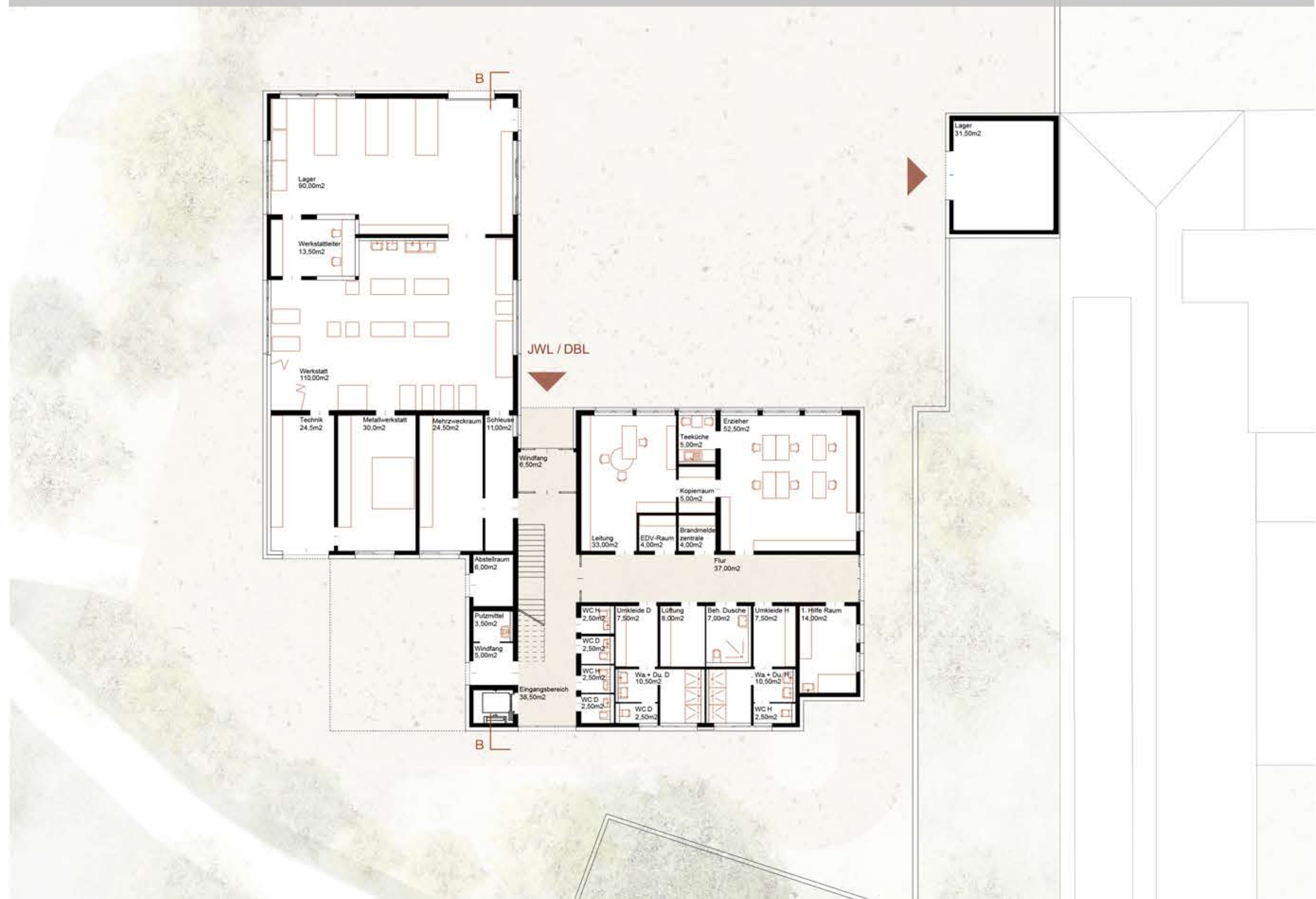
Grundriss Erdgeschoss | M 1:200